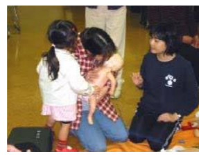
乳幼児心肺蘇生の講習