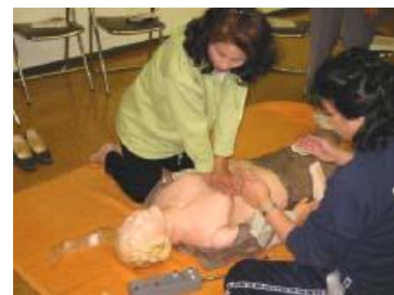
10.心臓マッサージの開始